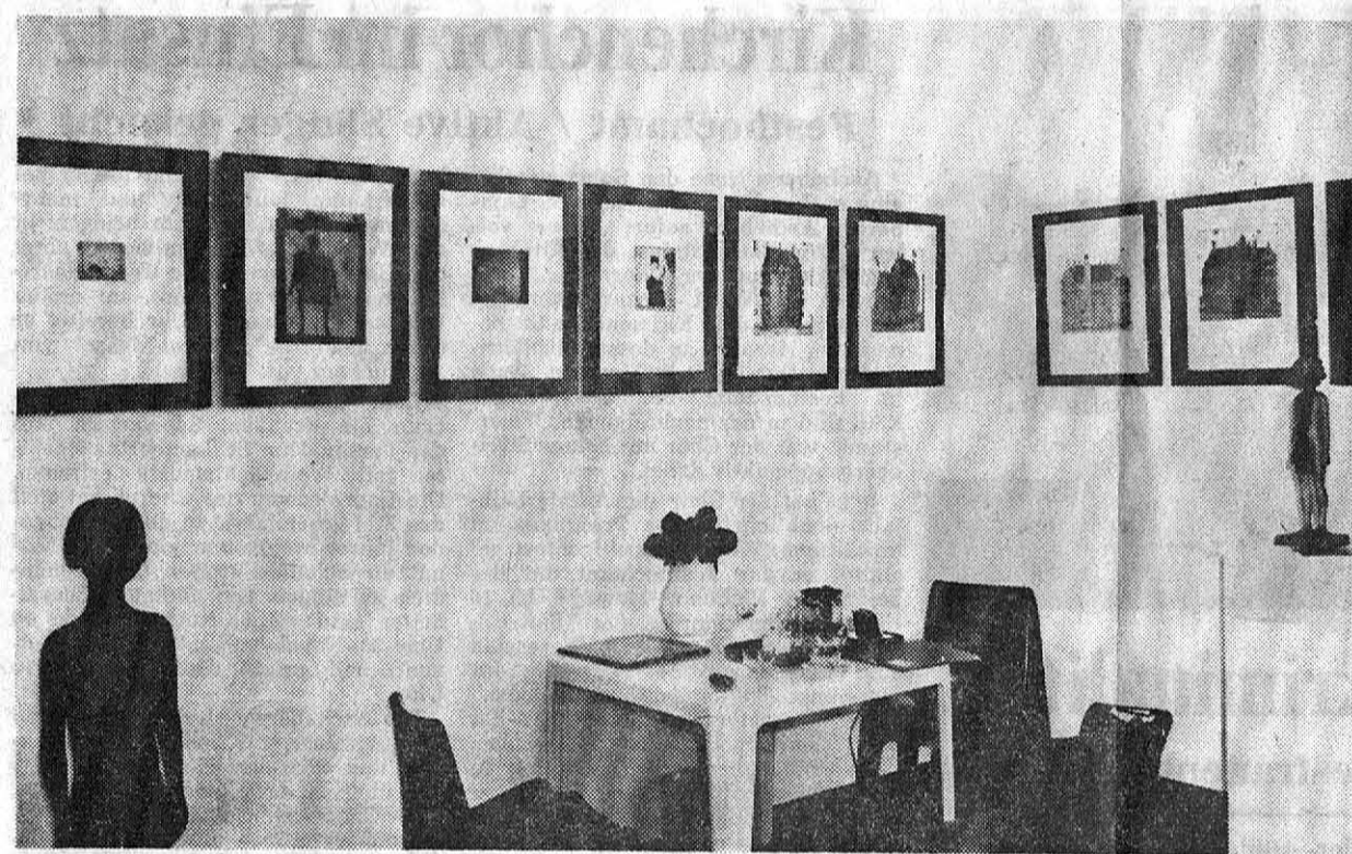
Ein Blick in das „Schaufenster“ des Künstlerehepaares Wittkamp/Fröhling an der Steverstraße